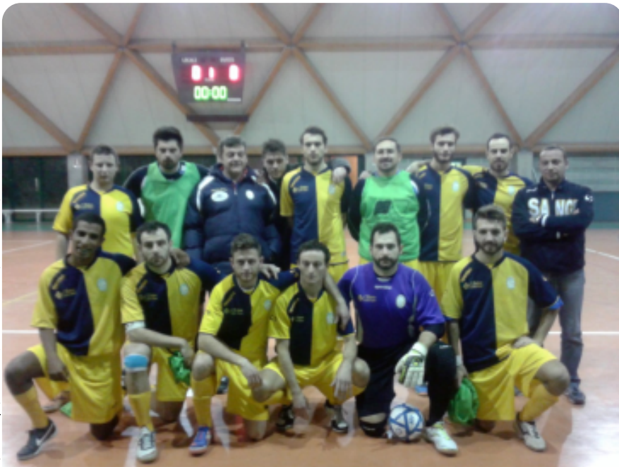
Atletico San Gimignano

La presentazione della prossima giornata: Derby senese per la Mens Sana, che ospiterà l'Atletico San Gimignano con l'obiettivo di centrare la nona vittoria casalinga della stagione. Trasferita che presenta qualche insidia per il San Giovanni, che se la vedrà con la rediviva Sestoese. Match interno per la Mattagnanese, opposta ad un Real Calceetto Rapolano scivolato nei bassifondi della classifica. L'Euroflorence proverà a riprendere la propria marcia playoff dalla partita esterna di Rapolano, contro